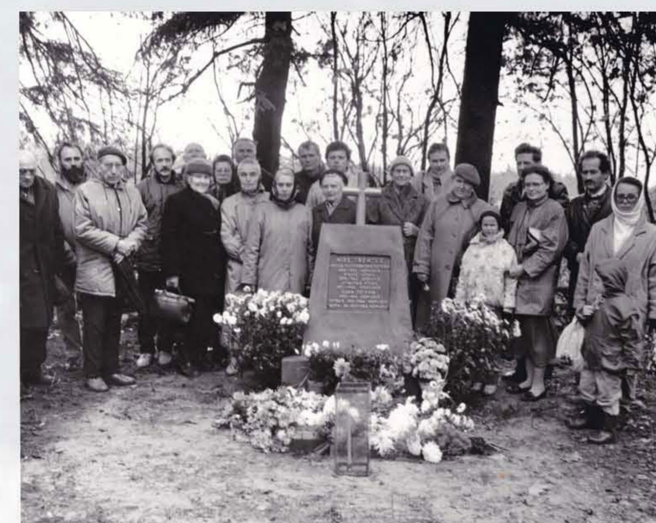
S. Putvinskio-Pūtvis giminaičiai Šilo Pavėžupio kapinėse prie paminklo, skirto Putvinskių-Pūtvių giminei nariams, žuvusiems tremtyje ir lageriuose atminti. 1991 m. spalio 19 d.