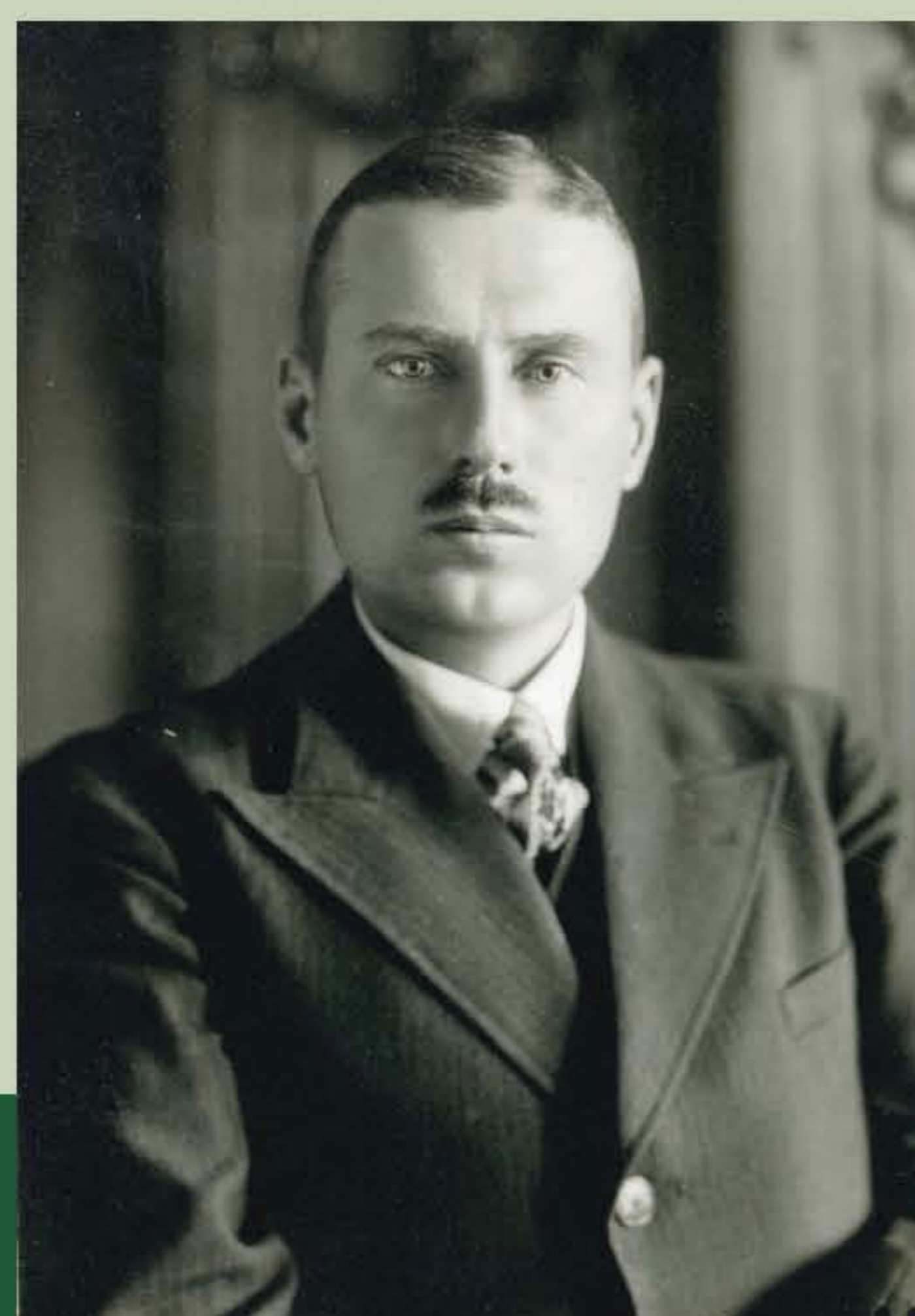
Stasys Putvinskis-Pūtvis – Žemės ūkio ministras, 1935 m.