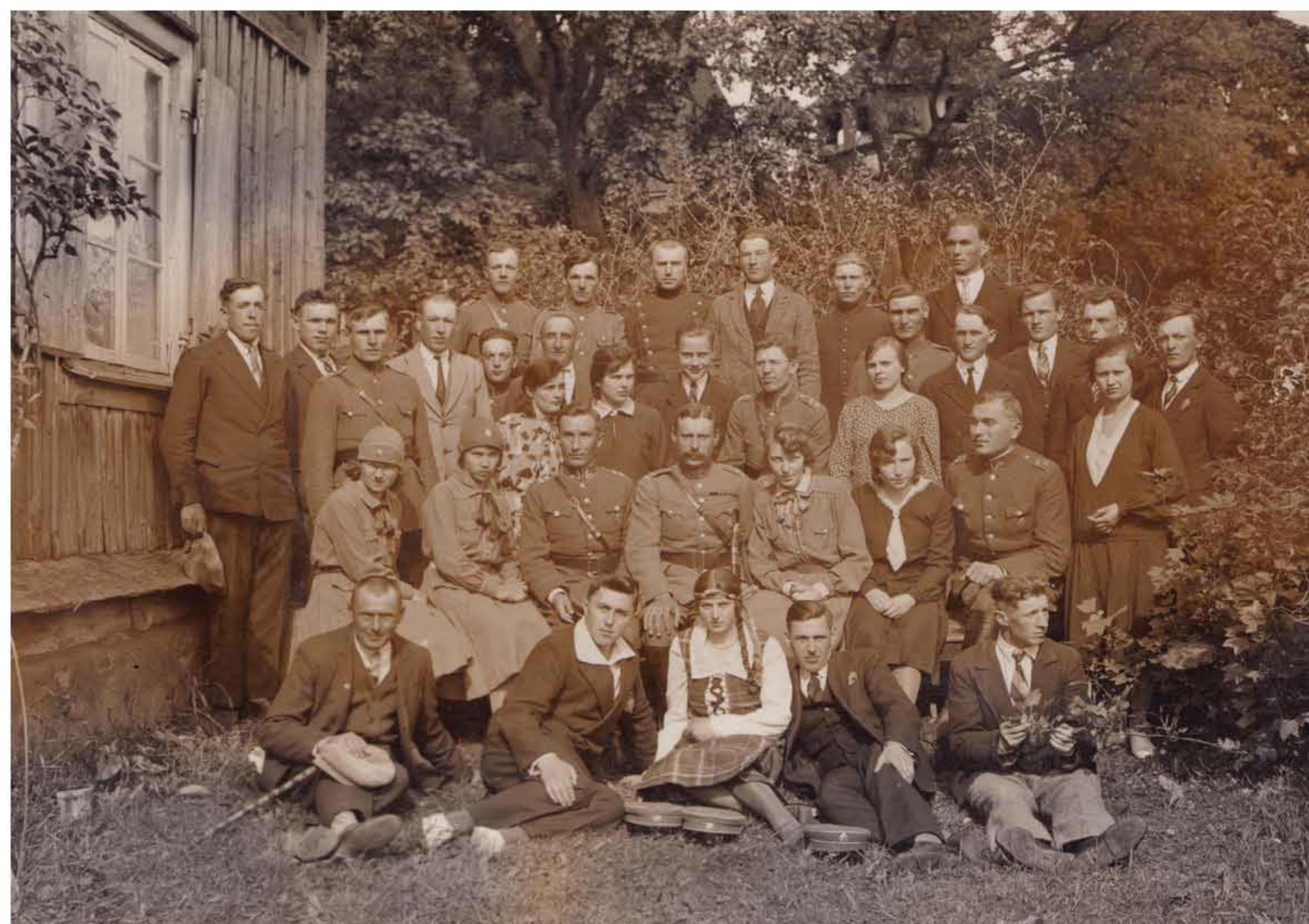
Šaukėnų šaulių būrio vadas S. Putvinskis-Pūtvis (sėdi centre) su šauliais. 1939 m.

Nuo 1935 m. rugsėjo 6 d. iki 1938 m. kovo 24 d. S. Putvinskis-Pūtvis ėjo Lietuvos Respublikos Vyriausybės XVII Ministrų Kabineto žemės ūkio ministro pareigas, 1936–1939 m. buvo Ketvirtojo Seimo narys. Sunkiai išgyveno 1938 m. Lietuvos vyriausybei primestą Lenkijos ultimatumą, ragino jį atmesti ir įžeistą valstybės garbę ginti ginklu. Priėmus ultimatumą, S. Putvinskis-Pūtvis pasitraukė iš einamų pareigų.