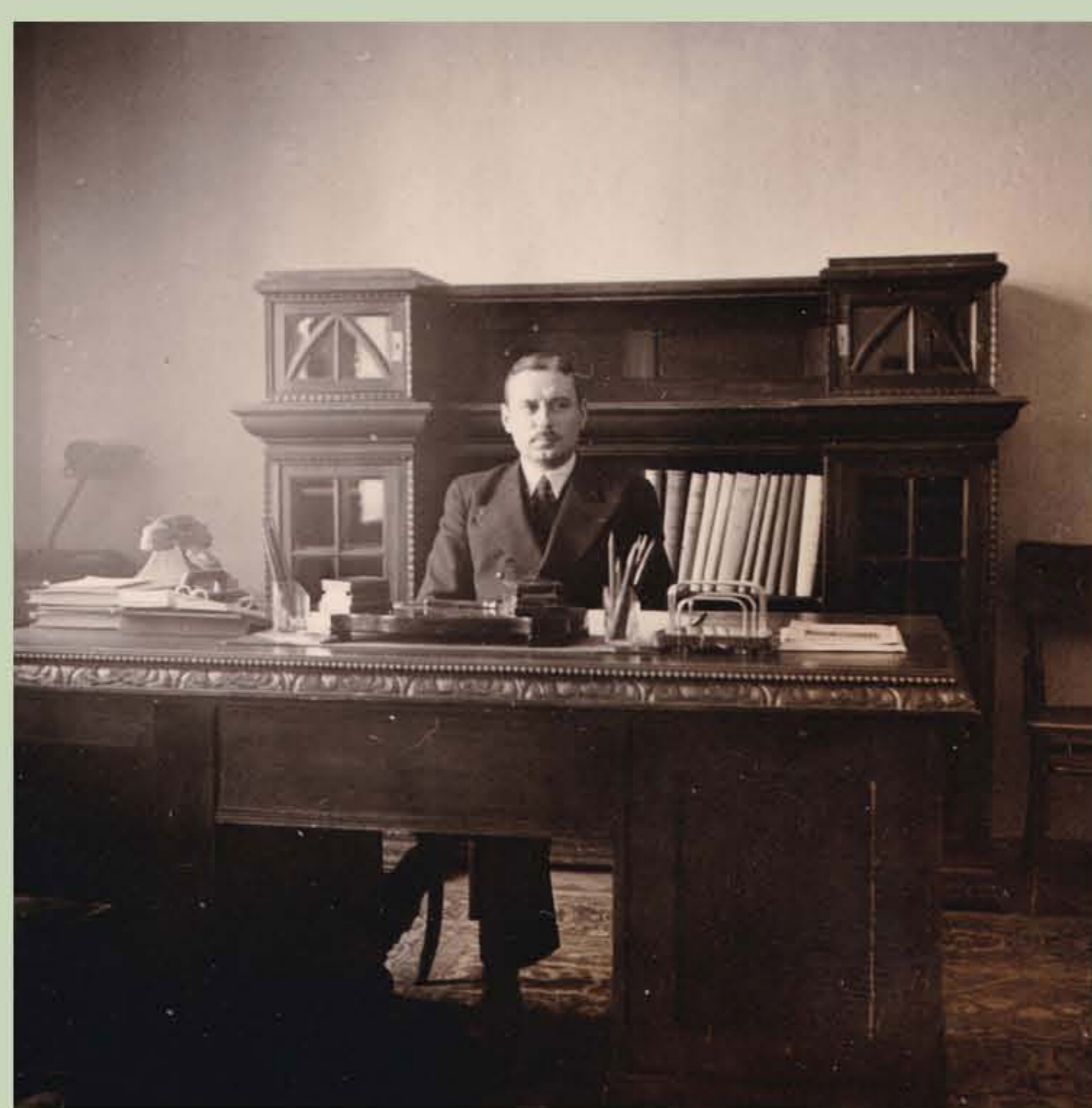
Žemės ūkio ministras S. Putvinskis-Pūtvis darbo kabinete. Kaunas, 1937 m.

Nepaisydamas užimtumo ūkyje, S. Putvinskis-Pūtvis aktyviai dalyvavo savo krašto politinėje ir visuomeninėje veikloje: įstojo į Lietuvos šaulių sąjungą, buvo Šaukėnų valsčiaus tarybos narys, Šiaulių apskrities tarybos pirmininkas, Žemės ūkio rūmų pirmasis vicepirmininkas. S. Putvinskio-Pūtvis namuose nuolat lankydavosi daug iškilų kultūros ir politikos žmonių. Šilo Pavėžupio dvarą ypač mėgo profesorius Tadas Ivanauskas. Kartą apsilankė ir Lietuvos Respublikos prezidentas Antanas Smetona.