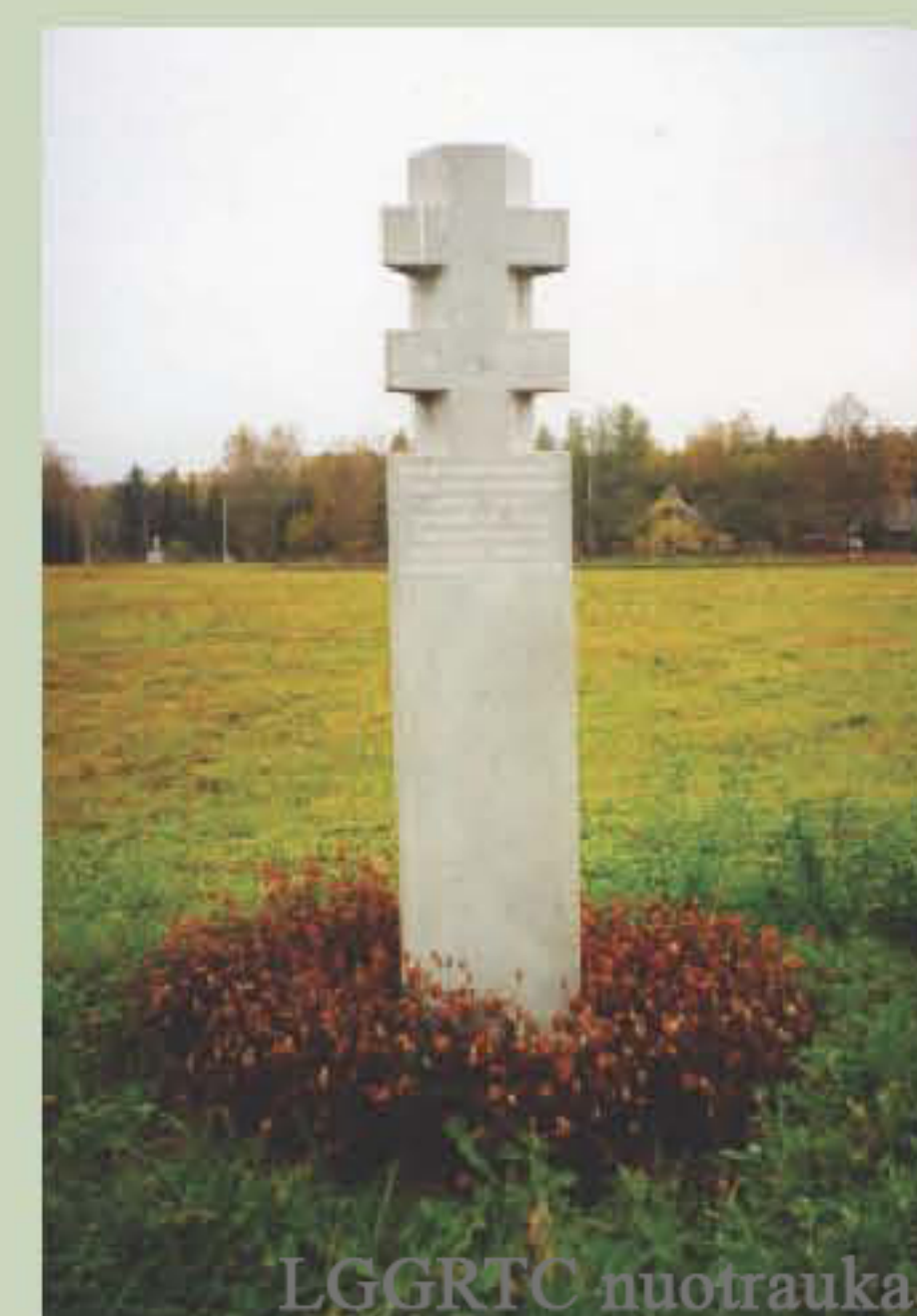
Parengė Rūta Trimonienė