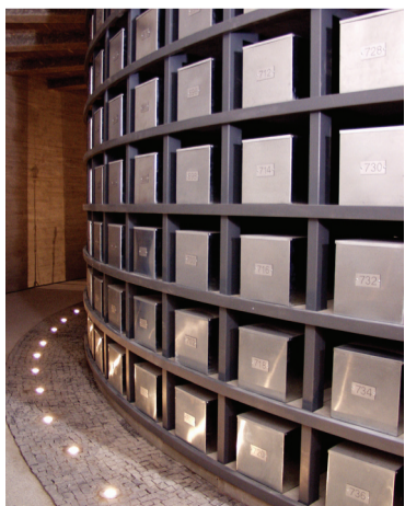
Koplyčios-kolumbariumo kriptų galerija.