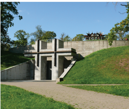
2004 m. Tuskulėnų rimties parko memorialiniame komplekse pastatyta koplyčia-kolumbariumas, kurioje ilsisi Adolfo Eidimto palaikai.