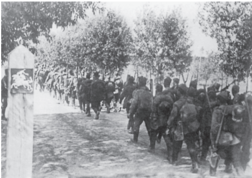
Sovietų Sąjungos kariuomenė peržengia SSRS–Lietuvos valstybinę sieną. Iš Lietuvos centrinio valstybės archyvo