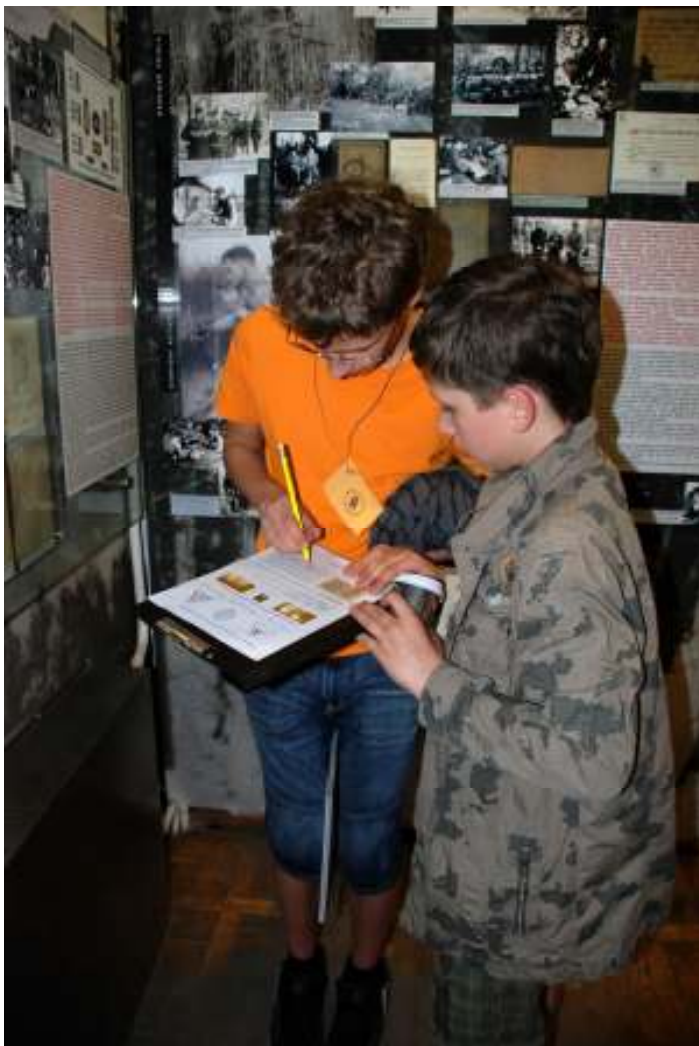
„Muziejų nakties“ jaunimui skirtas edukacinis užsiėmimas