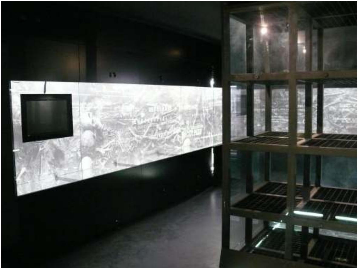
Būsimos ekspozicijos bendras vaizdas