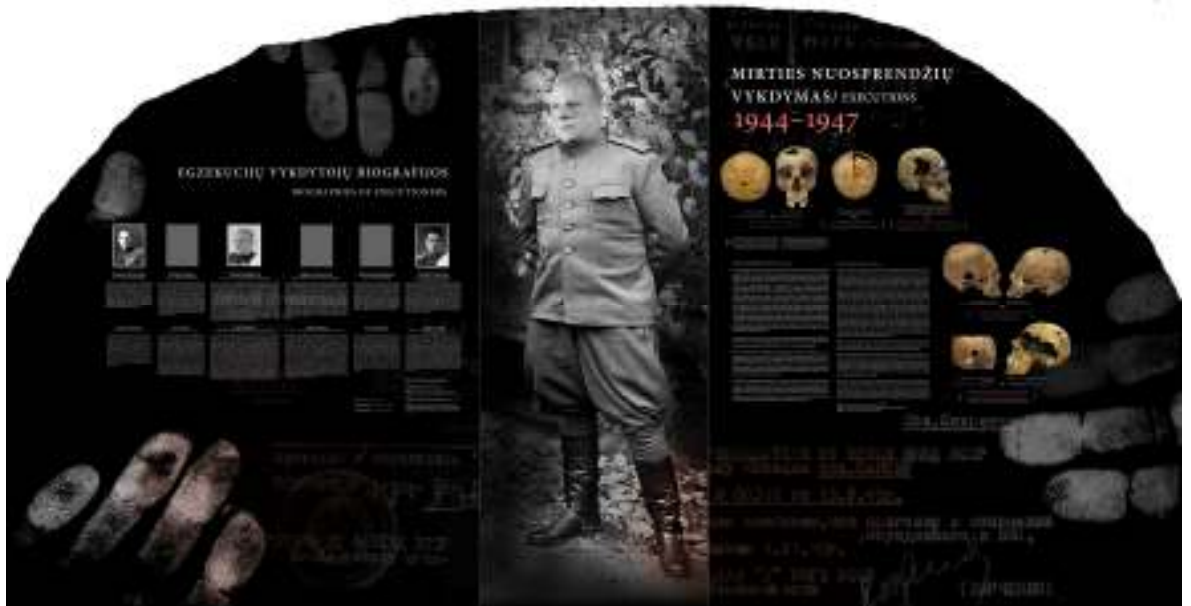
Viena iš ekspozicijos salių