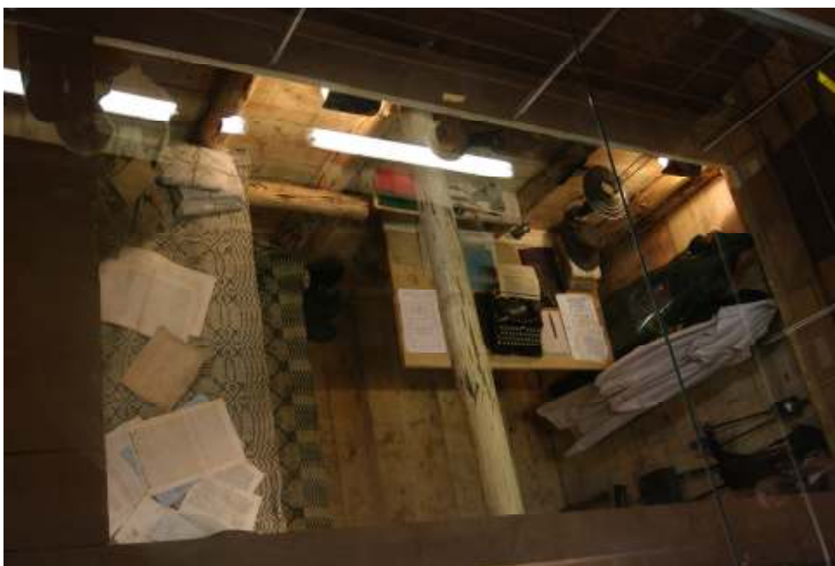
Atstatyto bunkerio ekspozicija