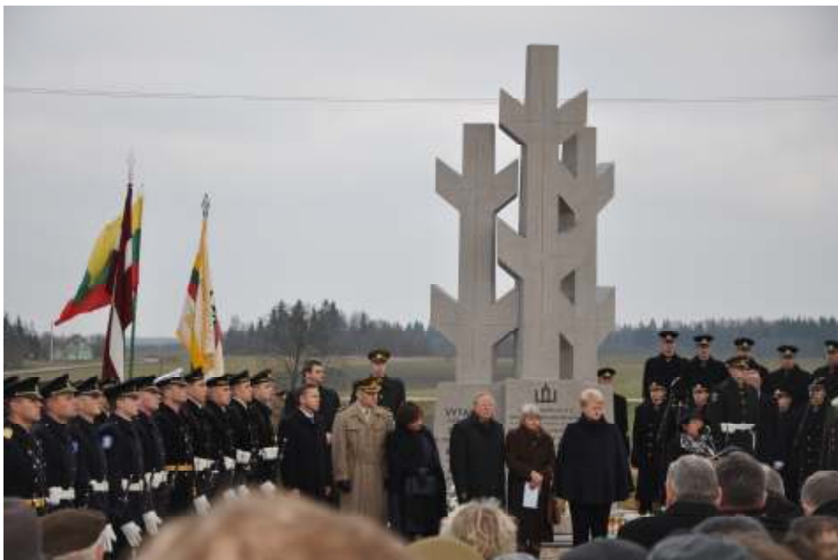
Memorialo atidarymo iškilmės