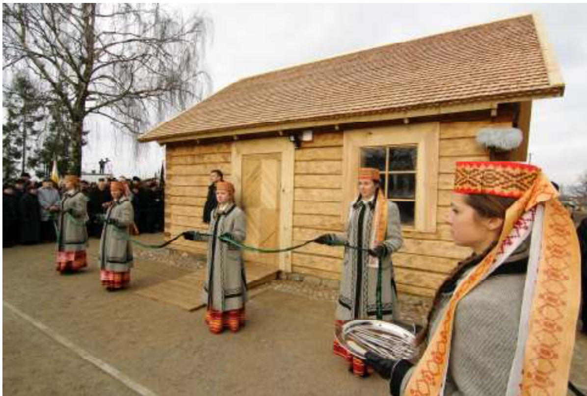
Klėtelė, kurioje atstatytas bunkeris